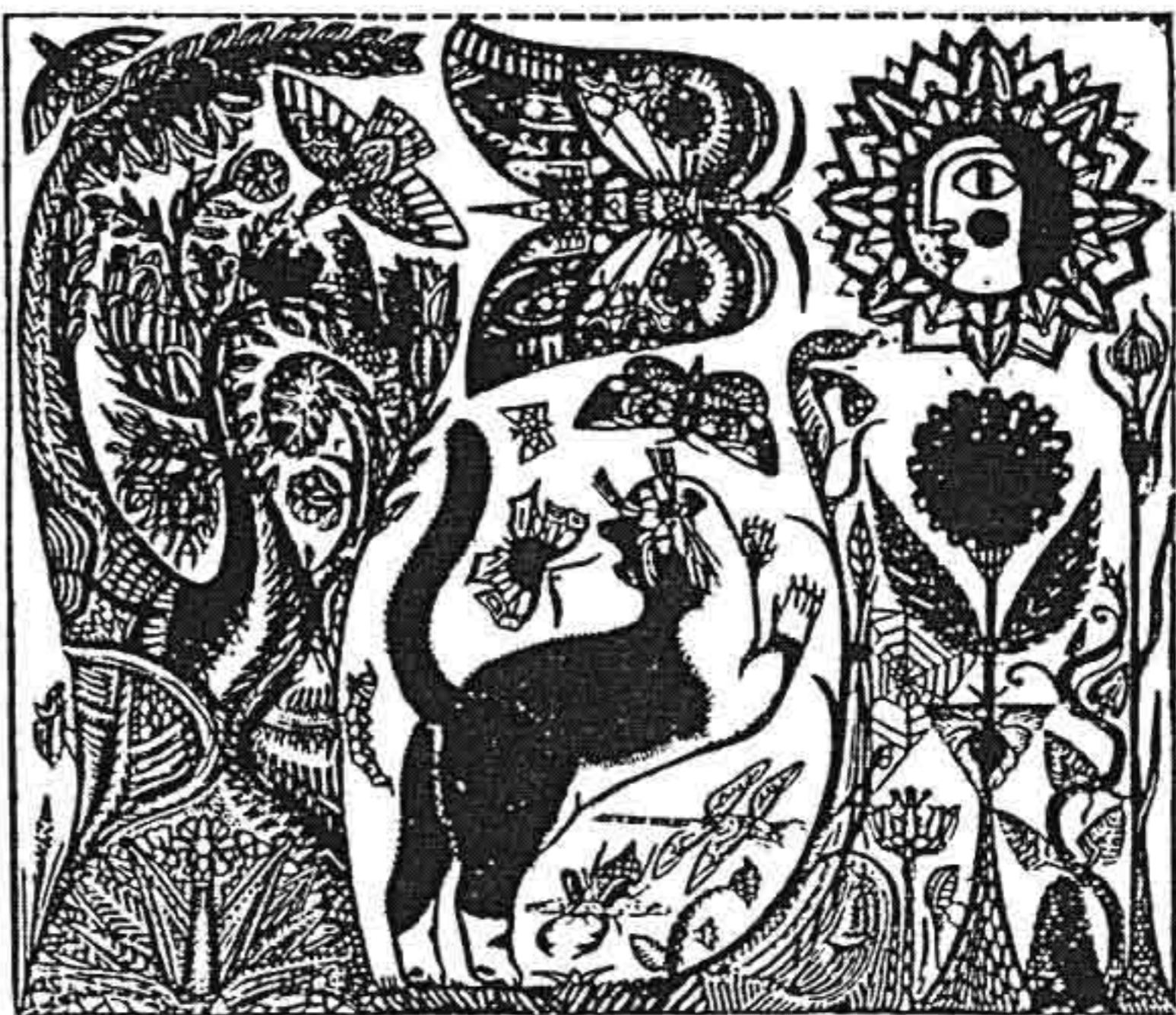
戴貝斯 彩色木刻(受中國桃花塢影響) 趙曼藏

整整花了一年多的時間，整理描繪法國各地歷史繁衍、朝代及不同背景的故事，將歷代陳跡壓縮於一個整體畫面上，要成就的不祇本身是「藝術家」，更是「人類學家」。其所畫的畫作、素描、平貼畫是屬於同一靈感的源頭，不論其立體、版畫，終結是同一感受。