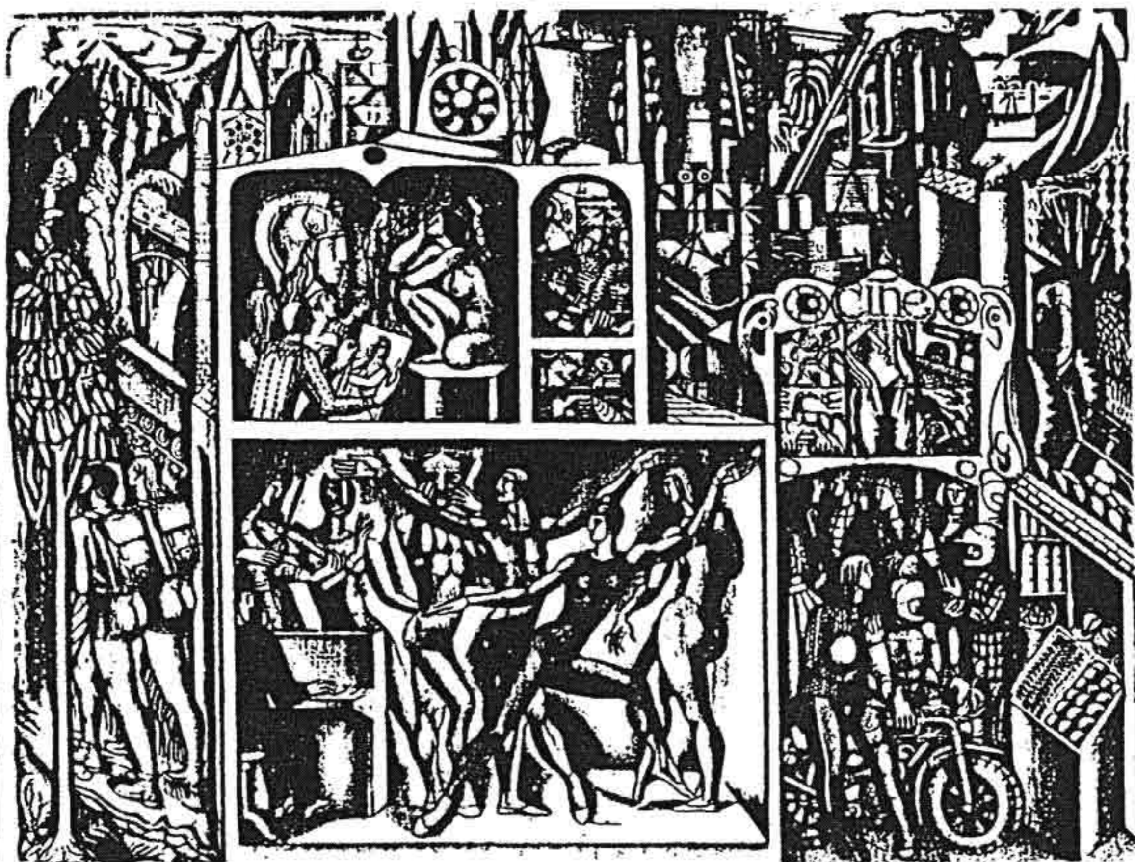
戴貝斯 理想的政府 石版畫