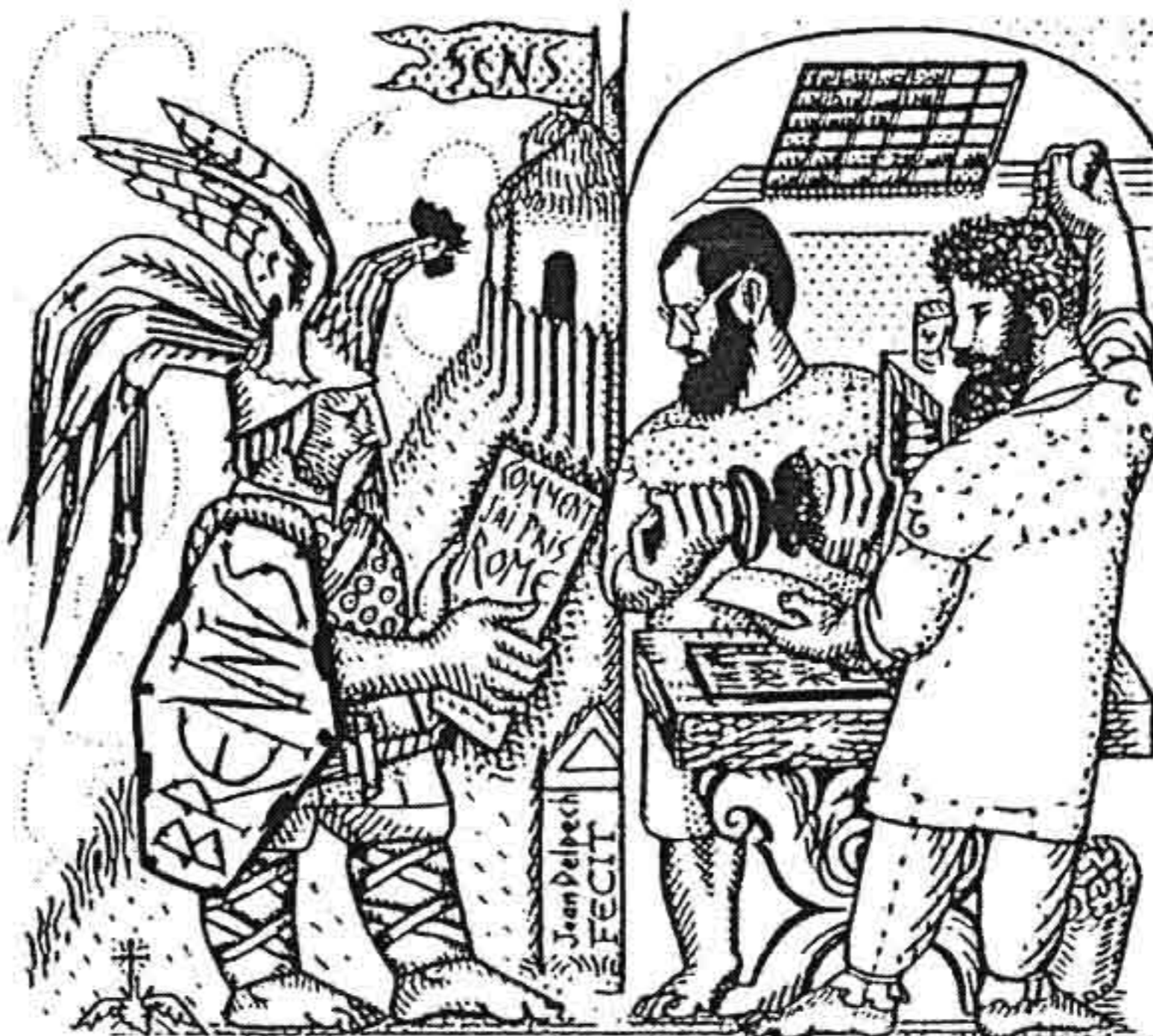
戴貝斯 古典石版畫

整整花了一年多的時間，整理描繪法國各地歷史繁衍、朝代及不同背景的故事，將歷代陳跡壓縮於一個整體畫面上，要成就的不祇本身是「藝術家」，更是「人類學家」。其所畫的畫作、素描、平貼畫是屬於同一靈感的源頭，不論其立體、版畫，終結是同一感受。