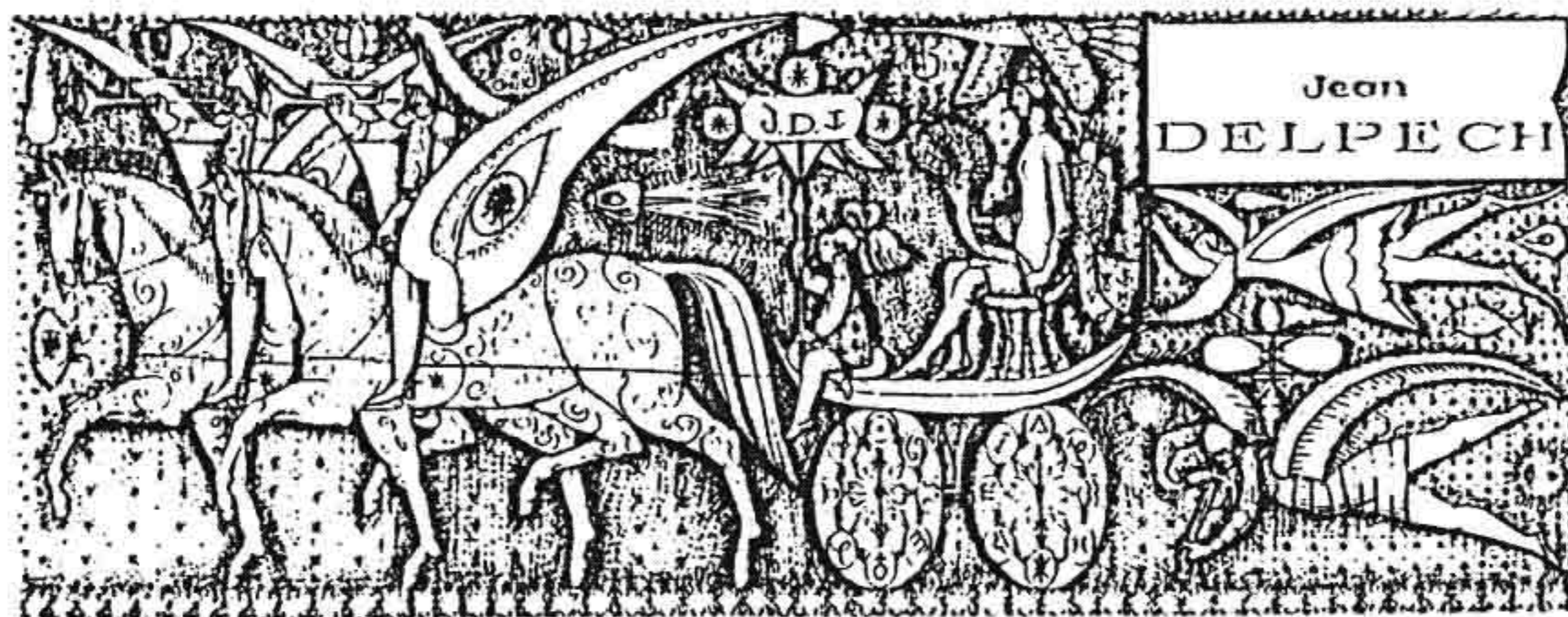
戴貝斯 最後的「作品」 木刻